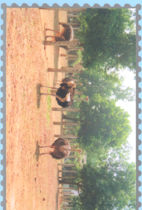
Đàn hạt nhân tại Trại NCBD Ba Vì thuộc Trung tâm NCGC Thủy Phương - Viện Chấn nuôi