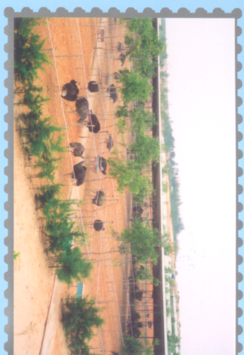
Đà điều nuôi ngoài sản xuất