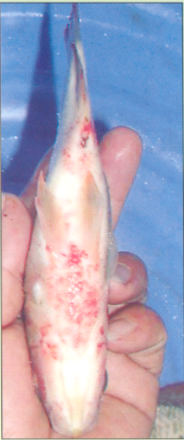
Cá rô phi bệnh xuất huyết

Thành phần: Chủ yếu gồm các tinh dầu của cây thuốc có tác dụng diệt khuẩn.