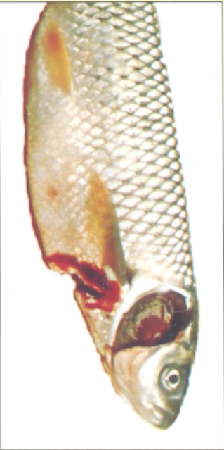
Cá trắm cỏ bị bệnh thối mang

Chữa bệnh: Cho cá liên tục từ 6-10 ngày.