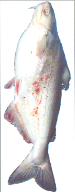
Cá ba sa bị bệnh xuất huyết