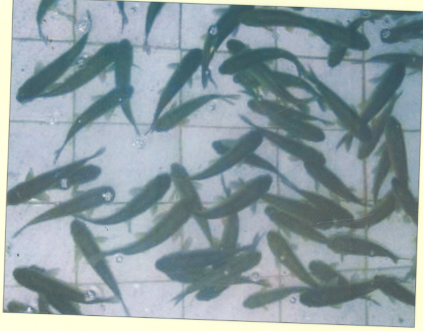
Cá trắm cỏ giống khỏe mạnh