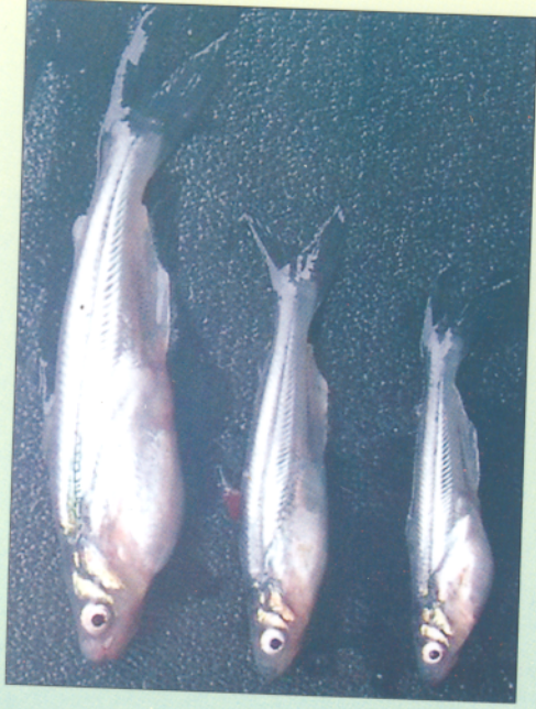
Cá tra giống bị bệnh bụng trắng to, có đốm trắng ở gan