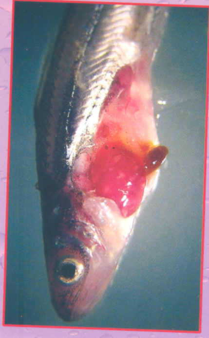
Cá tra giống bị bệnh đốm trắng ở gan